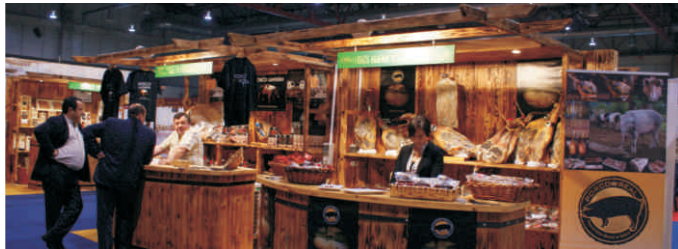
Stand de Soutos Galegos en Salimat

Do 10 ao 13 de xuño, ASOPORCEL e o Porco Celta acudiron, como cada ano á Silleda, para asistir á 33ª Feria Internacional Semana Verde de Galicia. A Raza Porcina Celta estivo representada cun total de 44 exemplares que estiveron á venda.