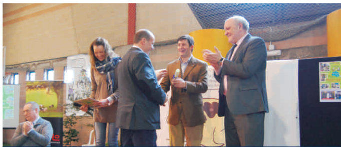
O coordinador de ASOPORCEL nomeado toxoleiro de honra

O 21 de febreiro tivo lugar en Sarria (Lugo) a segunda edición do cocido con carne de porco celta, unha xornada de exaltación gastronómica organizada pola asociación de Hostalaría e Turismo da Bisbarra de Sarria e co visto e prace de ASOPORCEL.