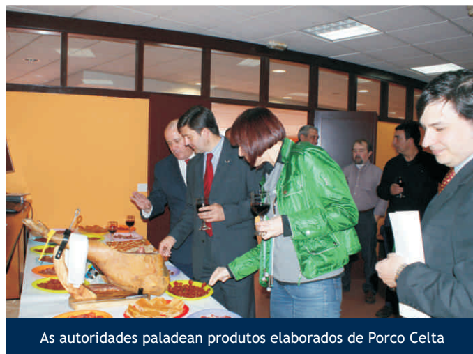
As autoridades paladean produtos elaborados de Porco Celta