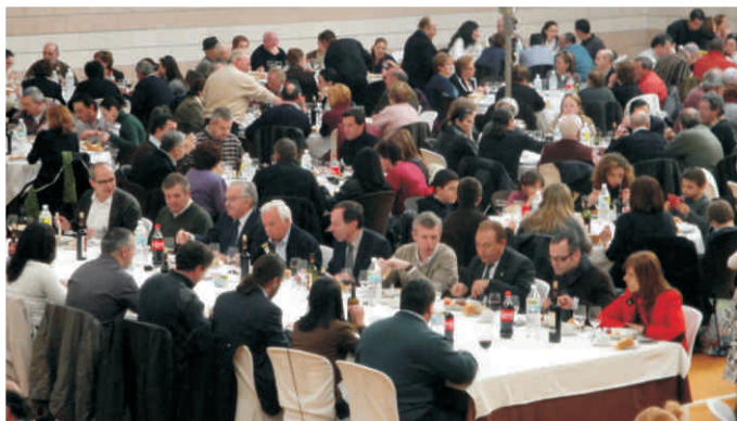
Multitudinario xantar de Porco Celta en Beariz

O pasado 14 de marzo e organizada pola SAT Oural de Beariz, o Concello de Beariz e ASOPORCEL, tivo lugar a IV edición da Festa do Porco Celta. Celebrada como sempre no pavillón polideportivo de Beariz (Ourense) a Festa estivo adicada aos galegos emigrantes, e en particular a México, debido á estreita vinculación dos veciños deste concello con dito país.